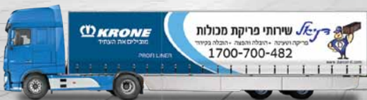
יילונות עם הדפסה